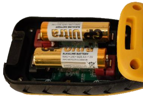
Fig. 2 – Cambio de baterías.

Alimentado por 2 baterías AA, que, por su bajo consumo, duran varios meses sin recargar. Para cambiarlas desatornillar la tapa trasera.