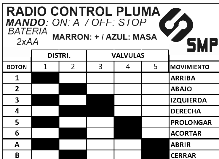
Fig. 3 – Esquema de conexiones en receptor.

Necesitamos un distribuidor / desviadora de caudal y 3 válvulas (que se instalan en las plumas manuales).