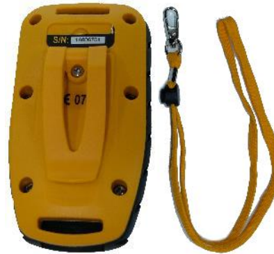
Fig. 1 – Clip trasero + Cordón.

Alimentado por 2 baterías AA, que, por su bajo consumo, duran varios meses sin recargar. Para cambiarlas desatornillar la tapa trasera.